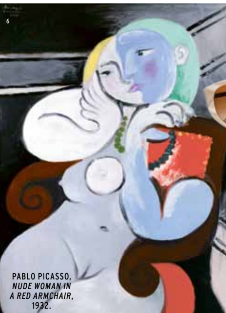
PABLO PICASSO, NUDE WOMAN IN A RED ARMCHAIR, 1932.